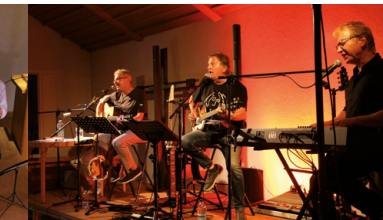
2021: Beatlesabend mit der Band MARDI GRAS