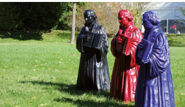
2017: Lutherfiguren auf der Christophoruswiese zum Reformationsjubiläum

Beim „Literarischer Herbst in Zorneding“ organisieren wir seit dem Jahr 2009 Lesungen der unterschiedlichsten Art. Mal kommen bekannte Autoren und Vorleser nach Zorneding, mal präsentieren wir selber Literarisches, Erzählungen und Gedichte, oft musikalisch umrahmt. Diese Veranstaltungsreihe hat inzwischen einen festen Platz im kulturellen Leben der Gemeinde Zorneding und des ganzen Landkreises Ebersberg gefunden. Besonders hat uns gefreut, dass der „Literarische Herbst in Zorneding“ Anfang 2018 für den Tassilo-Preis der Süddeutschen Zeitung nominiert wurde.