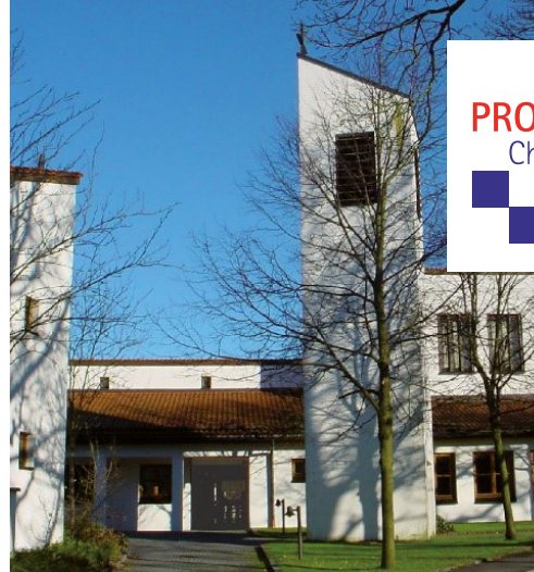
Die Christophoruskirche in Zorneding

Bitte senden an PRO Christophoruskirche e.V., Lindenstr. 11, 85604 Zorneding. Oder dort im Pfarramt der Christophoruskirche abgeben. Danke!