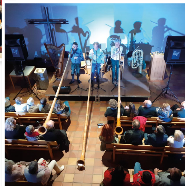
2022 Konzert „Well Brüder aus'm Biermoos“

Kulturelle Veranstaltungen des Vereins: Musik- und Zauberabende, Donnerstags-Kino (1 x im Monat), Besichtigungen (2005 - 2019), Flohmarkt im Frühjahr (1990 - 2019), Bücher- flohmarkt im Herbst (2005 - 2022), Veranstal- tungsreihe „Literarischer Herbst in Zorne- ding“ (seit 2009)