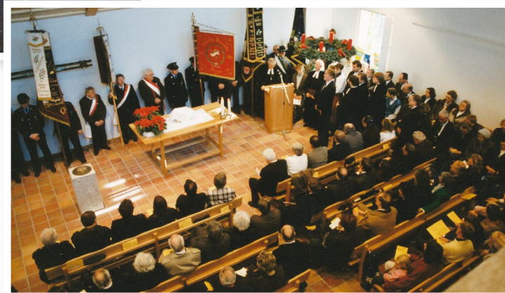
1989 Einweihungs- gottesdienst