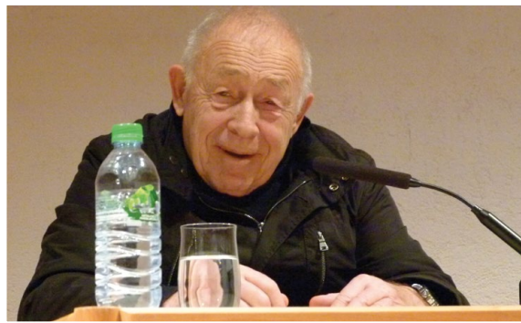
2016 Lesung Dr. Heiner Geißler