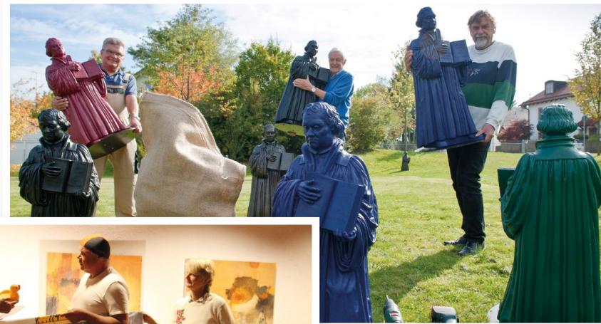
2017 Lutherfiguren auf der Christophorus- wiese