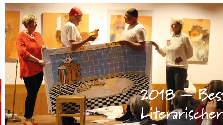
2018 – Best of Literarischer Herbst