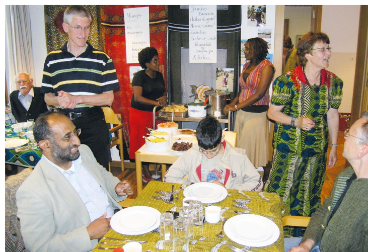
2007 Immer ein Raum für Fröhlichkeit: Hier mit unseren Freunden aus der tansanischen Partnergemeinde Makoga.