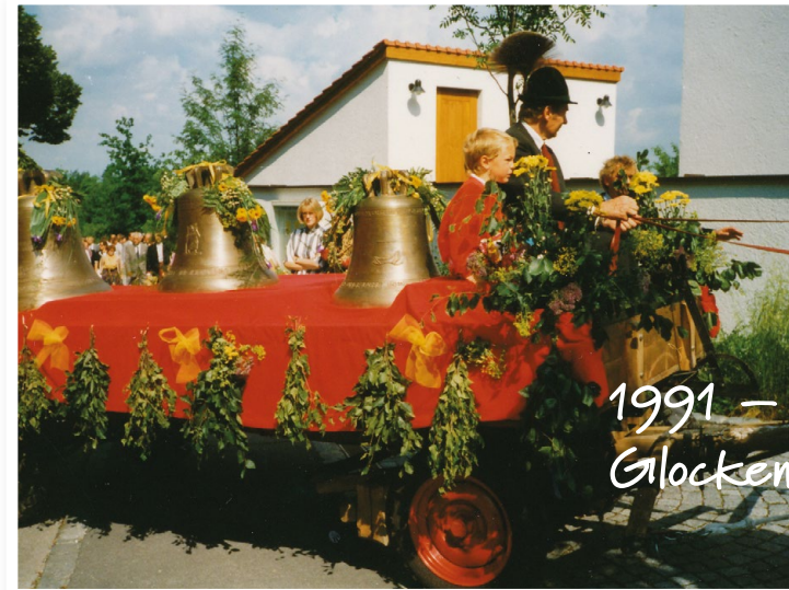
1991 – die Glocken kommen