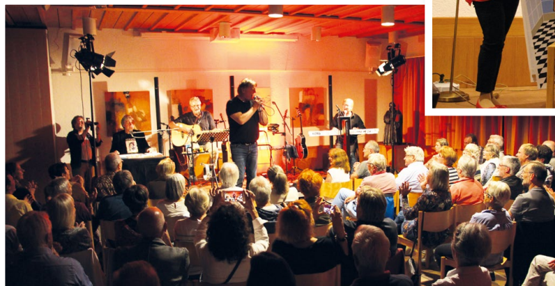
2020 Konzert Mardi Gras