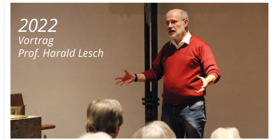
2022 Vortrag Prof. Harald Lesch